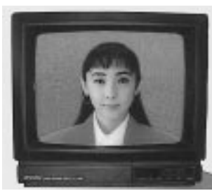
デジタル処理により、モニターを通じて映り具合をチェックして撮影ができる。

環境が厳しくなればなる程独創性が強く求められ先行が有利となる。現在のホリ写真館の在り方は如何に独自色を出し、他人より先に行くかと